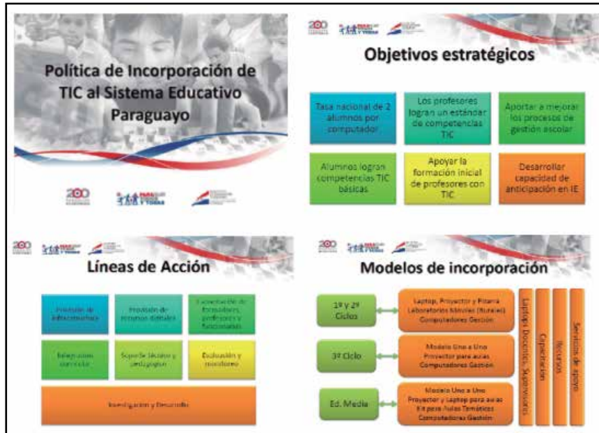
Figura 2. Diapositivas obtenidas de la presentación: “Políticas TIC en Paraguay”. Ministerio de Educación y Cultura, Paraguay.