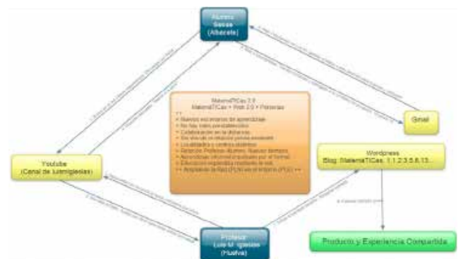
Matemáticas 2.0 en la distancia. Nuevos escenarios de aprendizaje.6

Y todo ello sin olvidar y recomendar el uso de redes sociales de docentes para hablar de matemáticas 51 . Es una forma de uso de la Web 2.0 que conlleva aprendizaje a través de contactos y del aporte de sus miembros a la red, mediante reflexiones, didácticas de aula y otros recursos aportados.