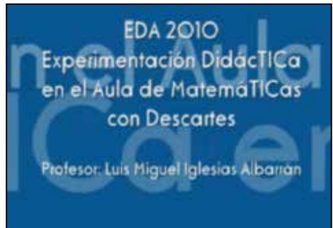
Sección multimedia del Site elaborado para la Experimentación Didáctica 27 .

ción, documentación, recursos y conclusiones 26 .