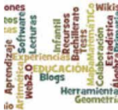
Proyecto de marcación social colaborativa. Matemáticas Compartidas.

En definitiva, matemáticas en comunidad. Matemáticas interactivas y colaborativa entre profesores-estudiantes-familias, matemáticas compartidas 50 por todos y para todos.