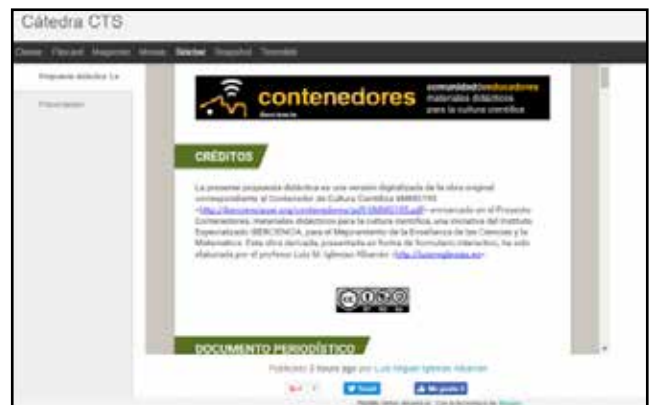
Capturas de pantalla mostrando el aspecto tras la conversión de un contenedor del Proyecto Contenedores para la Cultura Científica, en un formulario de Google y la inserción del mismo en un blog.