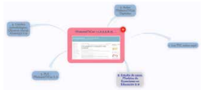
Figura 3: Mapa Mental. MatemÁTICAS 2.0 24

En el contexto descrito, hacer Matemáticas 2.0 implica explorar nuevos enfoques metodológicos con apoyo de nuevas herramientas tecnológicas que se utilizan con fines puramente didácticos. En definitiva, TIC y TAC para hacer matemáticas . No es sencillo, como he comentado en varias ocasiones a lo largo del artículo. Hay buena parte de actitud en ello, otra de disponibilidad de medios humanos y tecnológicos y una última, casi fundamental diría yo, relacionada con nuestra formación permanente actualizada como docentes.