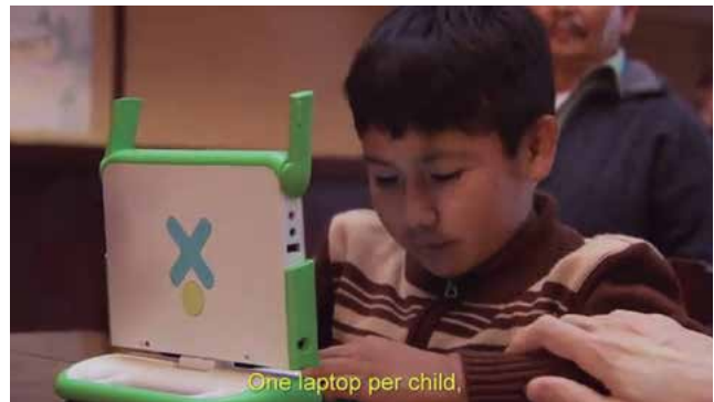
Figura 2. Captura de pantalla del video:

La idea es que cada escuela represente un nodo de aprendizaje. Un nodo en un recurso compartido a escala mundial para el aprendizaje. Animamos a ver tanto el mapa de despliegue 14 como el mapa de base del proyecto 15 , lo que nos permitirán hacernos una idea de la verdadera magnitud de este proyecto.