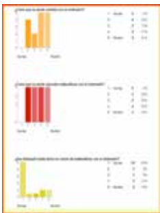
Encuesta inicial 28 . Experiencia previa del alumnado con TIC en Matemáticas antes de iniciar la Experimentación Didáctica.