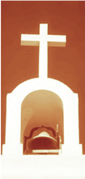
Campanario de la Recoleta, Asunción.

Los personajes que intervienen directamente en la historia, además de Sara y Miguel, son: Raúl, hijo de Sara; Aurorita, bebé cuya adopción se disputa; Irene, jueza; Lenin, Gorbachov (gatos) y Busch (perro), mascotas de Sara. Los animales son actantes 1 de fuerza afectiva, psicológica en la novela.