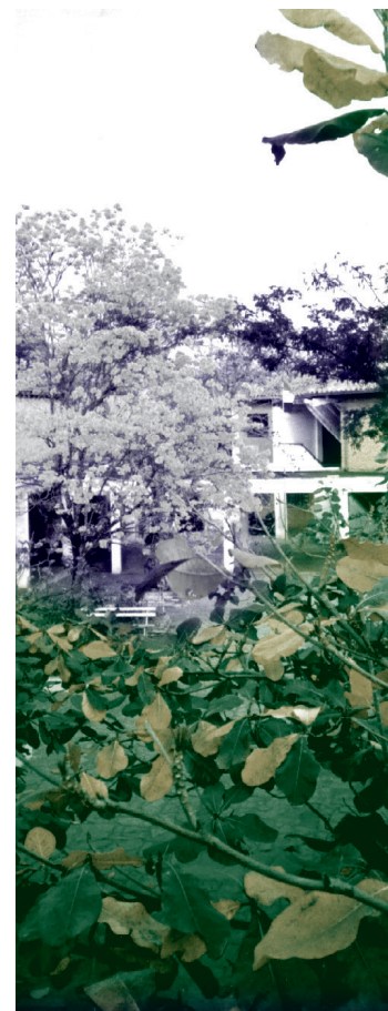
Barrio de la Recoleta, Asunción (fotografía).